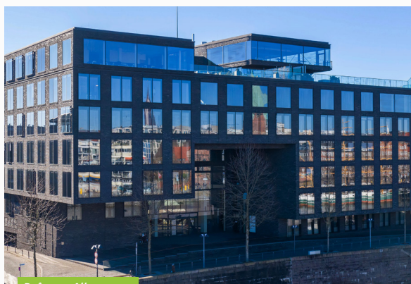
Brême - Allemagne

Les dernières acquisitions réalisées par Opus Real (2 immeubles de bureaux multi-locataires situés à Brême et Ratingen, acquis respectivement en août 2020 et janvier 2021) ont permis de consolider un portefeuille immobilier disposant de bons fondamentaux, dont la valeur dépasse ainsi les 165 M€. La qualité du patrimoine a notamment été retranscrite par la revalorisation du prix de la part de 1 % depuis le 1 er mai 2021. La bonne diversification locative de la SCPI (aucun locataire ne représentant plus de 15 % des loyers), combinée aux perspectives favorables propres au marché immobilier allemand, nous permettent d'être raisonnablement optimistes pour les futures performances d'Opus Real, en cas d'évolution favorable du contexte sanitaire au cours des prochains mois.